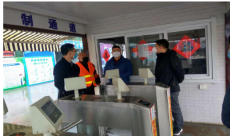
△公司领导班子视察东湖嘉景项目,项目负责人介绍基本情况

工作情况,视察了解疫情防控与复工过程中疑难点。本次视察,公司领导班子重点查看了现场安全施工落实开展、防疫物资储备发放、作业人员安全防护、现场安全资料整理等情况。