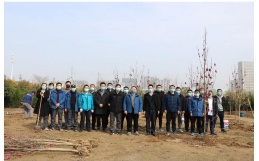
▽全体植树人员合影